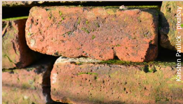
Karsten Paulick - pixabay