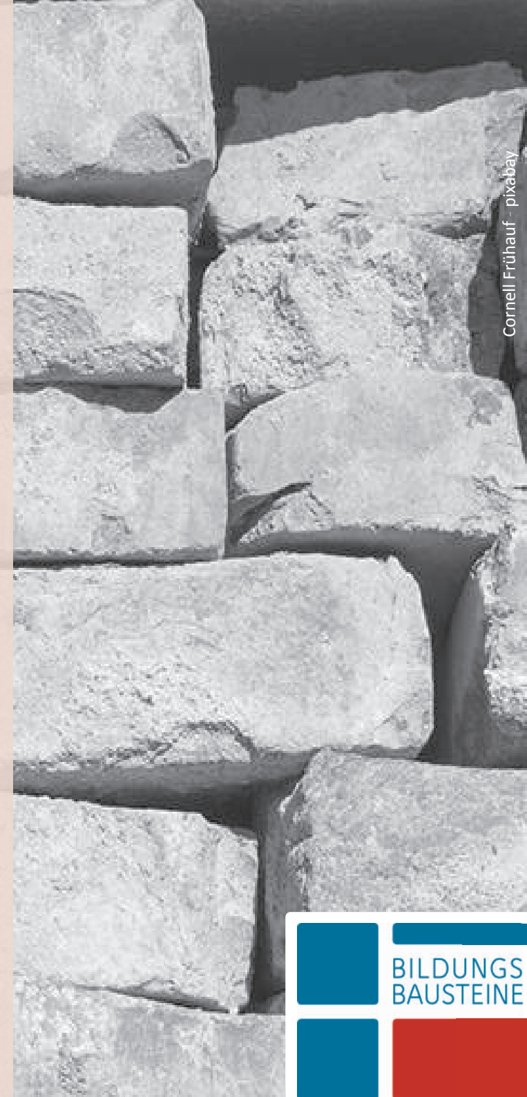
Cornell Frühauf - pixabay